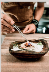
Dieses Bild überspringen