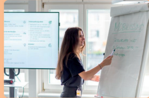
Berufsausbildungen bei der Post